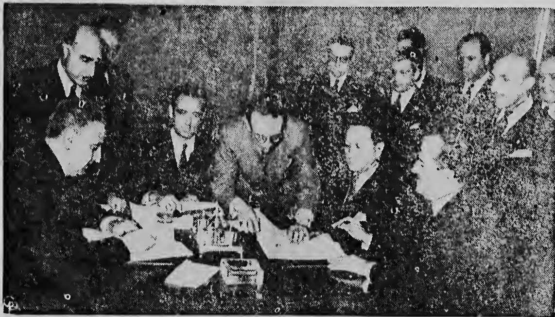
IN EEN UNIVERSITEIT TE MADRID werd door de Spaanse minister v. buitenl. zaken, Alberto Artanjo (links) en de Colombiaanse ambassadeur in Spanje, Guillermo Valencia (rechts), een accord getekend ten behoeve van de studenten van zowel Spanje als Colombia. DEN UN UNIVERSIDAD NA MADRID un acuerdo a worde firma entre e Ministro Spanjo di Asuntunan Estranhero, Alberto Artanjo (banda robez) y e embajador Colombiano na Spanja, Guillermo Valencia (banda drechi). E acuerdo aki ta concerna studiantenan na Colombia tanto como na Spanja.